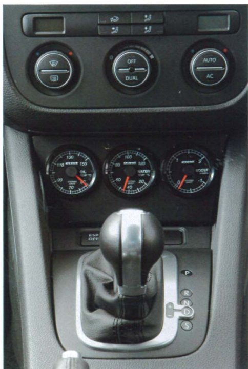
←ゴルフV専用ということでセンターコンソールに違和感なくセットアップできるホルダーが付属する。ブースト計があるのでGTIやTSIといったターボカーにオススメだ。メーターの位置はドライバーに近い右側から重要度の高い順番にブースト計、水温計、そして油温計を推奨している

このデジタル式アナログメーターともいうべきピボット自慢のアイテムは今まで、ひとつの本体で3種類