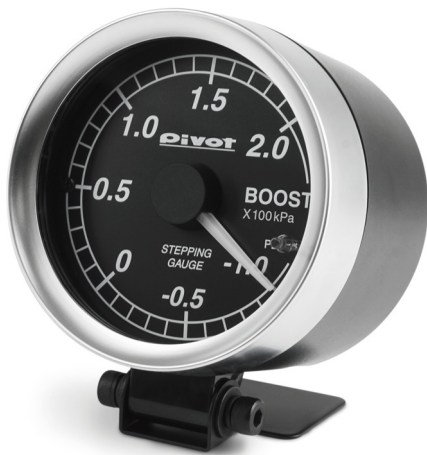
GEKKO X OBD STEPPING GAUGE